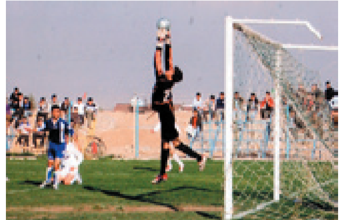
گۆلچی هه‌ندرین له‌ گرتیه‌ کدا