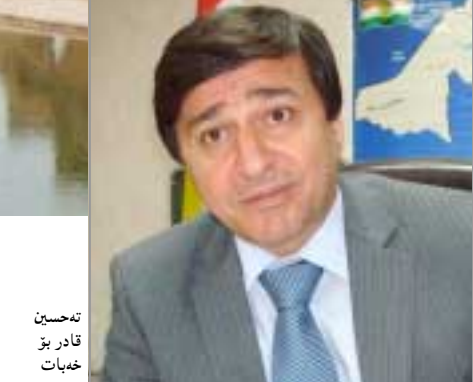
ته‌حسین قادر بۆ خه‌بات

به‌نداوی بیخمه دواتر له‌به‌اره‌ی سه‌رانه‌که‌ی وه‌زیری سه‌رچاوه‌ ئاوه‌یه‌که‌گانی ئه‌یراق و دوو‌سه‌تکردنی به‌نداوی بیخمه‌ گه‌وتی: ئه‌مه‌ په‌شته‌یوانی له‌دروسته‌کردنی