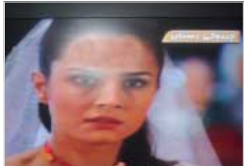
گرتەبەک لەزنجیری دۆبلاژکراوی چیرۆکی زستان

لەو لایەمی ئەوێ کە تا چەند زمانی ئەو قەبە دۆبلاژکراوانە لەزمانی ستاندارد دور دەبینن ھەر وەھا دەلیت: بەراسەتی من خۆم وەک تاکەکەس ئەو بە دور دەبینم لەزمانی ستاندارد بەلکو وەک شتیو زاراوەی ناوچەبەکە جا لەوژھەڵاتی کوردستان یان یاکووری کوردستان کە کردووینە بەزمانی دۆبلاژ کە پێتم وایە زۆر پە لە ھەلەبە وکارێگەری خراب لەسەر بێسەر