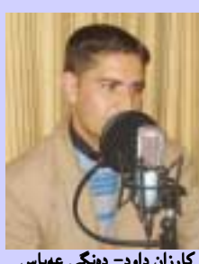
کارزان داوود- دەنگی عەباس