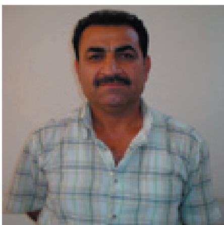
كانه بي عه زيز