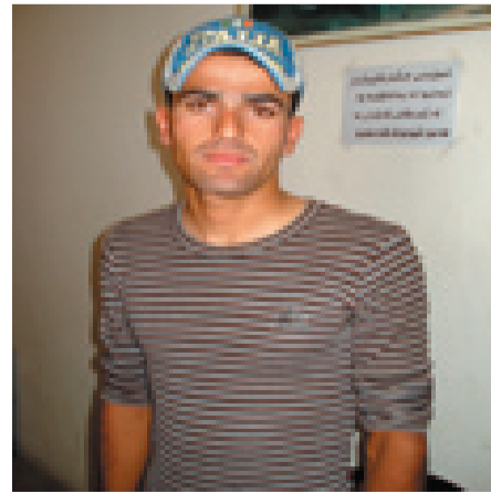
سامان محمه د