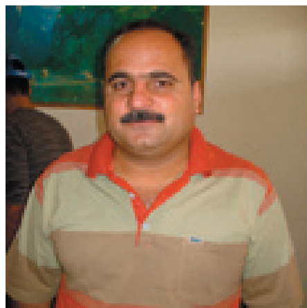
خه سرۆ قه ساب